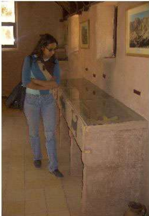
QUITOR Sala de exhibición actual